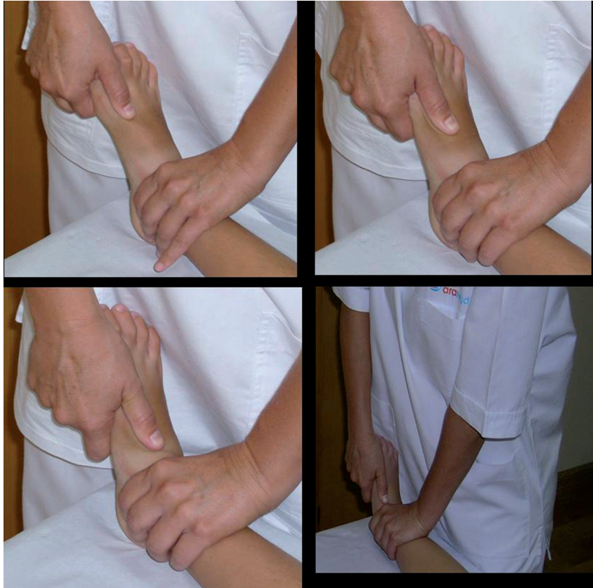
Figura 2 Técnicas de movilización y articulación del primer radio y thrust de escafoides.