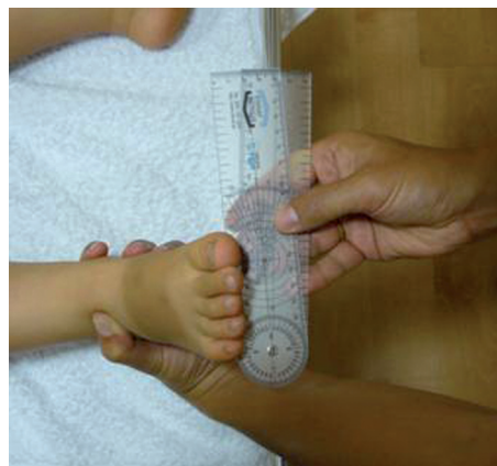
Figura 1 Goniometría de varo de antepié.

Las técnicas osteopáticas de corrección utilizadas para devolver movilidad al complejo articular afectado en varo o inversión son: