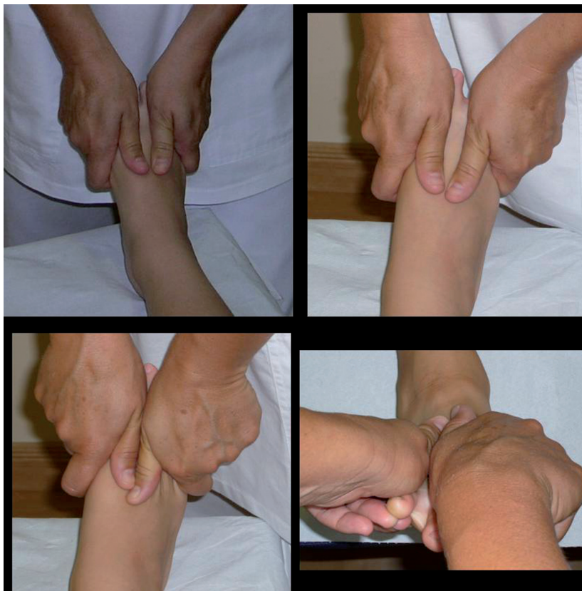
Figura 3 Técnicas de movilización y articulación del 2.º, 3.º, 4.º y 5.º metatarsianos.